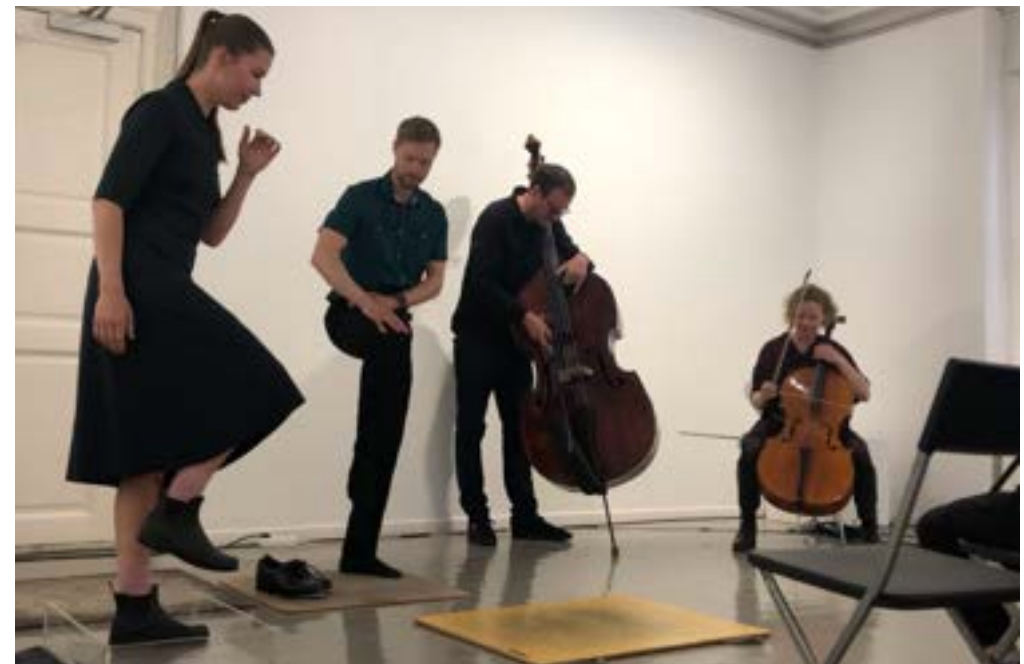
Venstre: Fujiko Nakays publikasjon Letters Sent from Heaven . Høyre over: Noa Eshkol Chamber Dance Group. Høyre under: nyMusikk, Marco Fusi + SALONG.